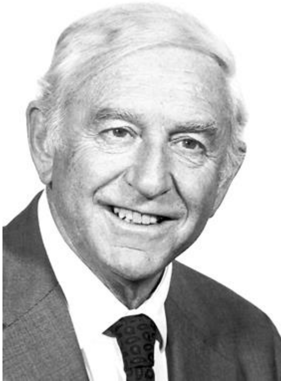
Nobel Prize, 1985